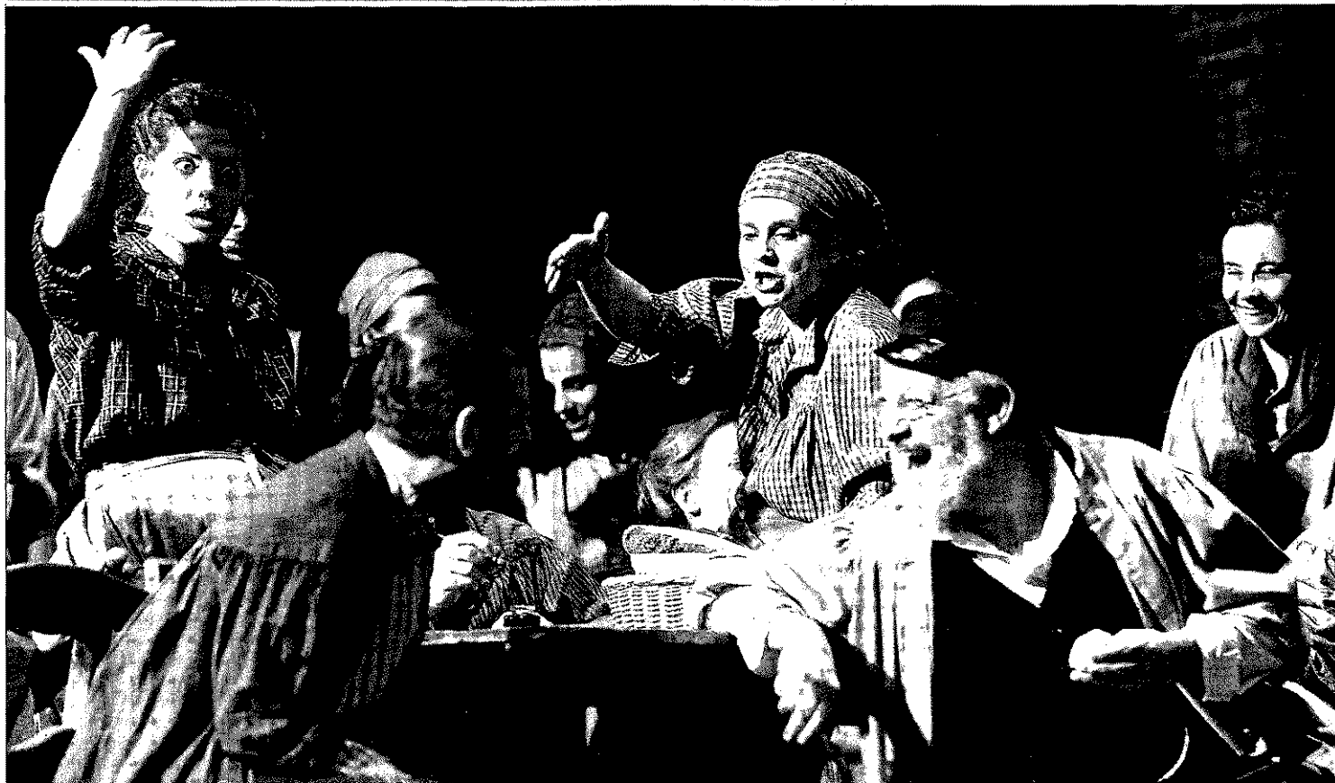
Les dones eren majoria a les fàbriques tèxtils i Sergi Belbel s'ha permès la llicència de canviar el sexe d'alguns personatges de l'obra d'Àngel Guimerà ■ TERESA-MIRÓ

'En Pólvora', d'Àngel Guimerà, un espectacle de gran format dirigit per Sergi Belbel, transforma la Sala Gran del TNC en el pati d'una fàbrica tèxtil del segle XIX