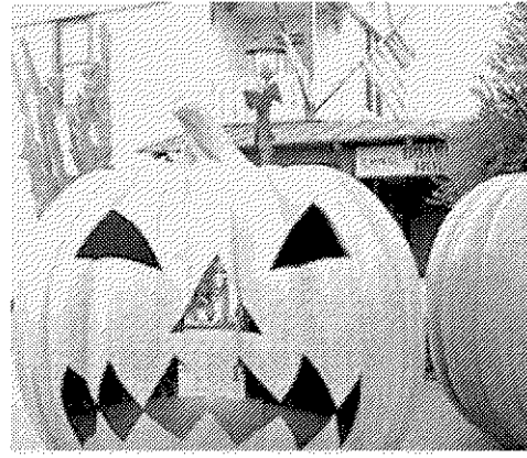
La fiesta de Halloween es ya un clásico en Port Aventura.

Con nombres tan tenebrosos como 'La selva del miedo', 'La mina del diablo', 'La hora Gore', 'El 'saloon' de medianoche' o 'La hora de los pecados', entre muchos otros, el parque temático Port Aventura propone estos días todo tipo de actividades para los más valientes. Y es que la fiesta de Halloween se ha convertido en los últimos años en uno de los máximos reclamos del complejo lúdico. Una buena oportunidad para descargar adrenalina y para presumir de valentía.