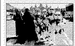
>>> Fans de la saga.