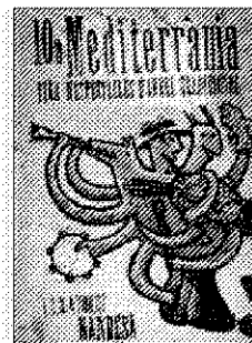
►► Cartell de la mostra.

Tibidabo Aquest parc d'atraccions té instal·lacions per a tots els públics, des d'una àrea per als més petits fins al Pèndol. A més a més, té un cine en quatre dimensions. Dificidat. Plaça del Tibidabo, 3. D'11.00 a 19.00 hores. Entrada: 24 euros; nens de menys d'1,20 d'altura, 9 euros. Informació: 93.211.79.42 i a la pàgina www.tibidabo.es .