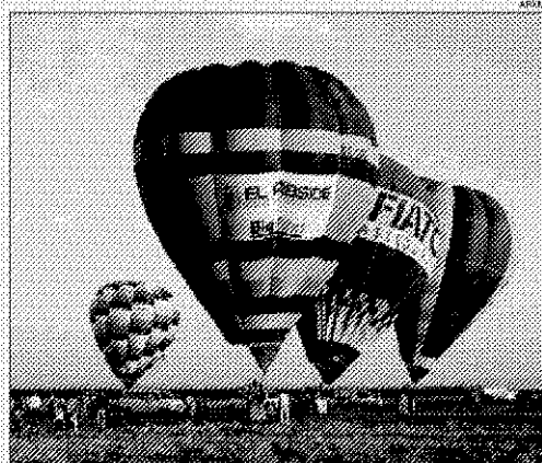
>>> Els equips es preparen per competir en una prova a Mollerussa.

>>> Pistes de Vol de la Serra. Mollerussa. Pla d'Urgell. 8.30 i 15.30 hores.