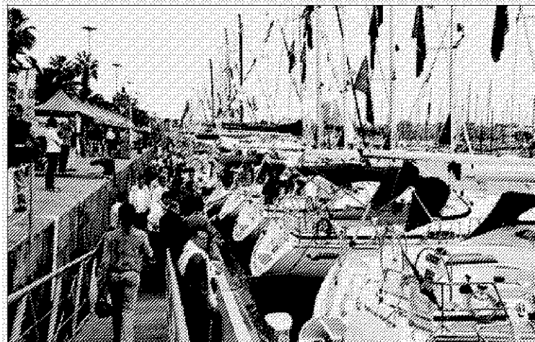
>>> Exposició de vaxells al Port Vell, a l'última edició del Nàutic.

La festa de Sant Narcís de Girona arriba als seus últims dies. Avui, dissabte, hi haurà una simultània de circ a la plaça de Picasso (11.00 h) i l'actuació del Circ Raky a la rotonda de Fontajau (18.30 i 20.45 h), actuació que repetiran demà, diumenge (12.00, 16.15 i 18.30 h). La música la posaran la Banda Musical d'Abllitas (Navarra) i la Girona Banda Band a la rambla de la Llibertat (12.00 h) i els Pell de Serp, Marky Ramone i Tokio Sex Destruction (passeig de la Copa, 23.30 h). Demà hi haurà una cervalla de gegants des de la plaça de Sant Felu (11.30 h) fins a la plaça de la Constitució, on hi haurà sardanes (16.30 h). La festa finalitzarà amb un castell de focs artificials a Fontajau (20.00 h). E.A.