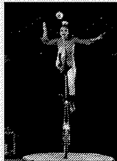
>>> Actuació del circ Raky.

La festa de Sant Narcís de Girona arriba als seus últims dies. Avui, dissabte, hi haurà una simultània de circ a la plaça de Picasso (11.00 h) i l'actuació del Circ Raky a la rotonda de Fontajau (18.30 i 20.45 h), actuació que repetiran demà, diumenge (12.00, 16.15 i 18.30 h). La música la posaran la Banda Musical d'Abllitas (Navarra) i la Girona Banda Band a la rambla de la Llibertat (12.00 h) i els Pell de Serp, Marky Ramone i Tokio Sex Destruction (passeig de la Copa, 23.30 h). Demà hi haurà una cervalla de gegants des de la plaça de Sant Felu (11.30 h) fins a la plaça de la Constitució, on hi haurà sardanes (16.30 h). La festa finalitzarà amb un castell de focs artificials a Fontajau (20.00 h). E.A.