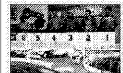
>>> Participants de les proves.

L'Associació de Comerciants i Amics de la Rambla del Poblenou celebrarà avui l'11a Trobada de Seat 600. Més de 60 vehicles desfilaran pels carrers i places del barri. La caravalla finalitzarà a la plaça de Valenti Almirall. Rambla del Poblenou, entre Ramon Turó i Puigades. De 9.00 a 15.00 h.